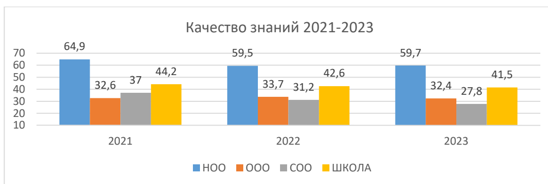
Рис. 2. Качество знаний 2021-2023 гг.

Из приведенных данных видно, что в целом по школе на протяжении последних 3 лет наблюдается снижение успеваемости и качества знаний.